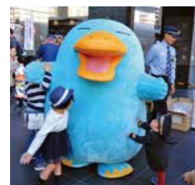
イコちゃんに参加されたお子さん達