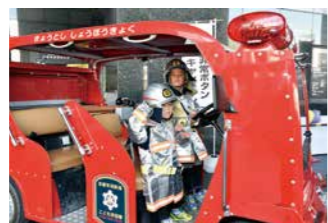
「こども防火服・ミニ消防車」コーナー