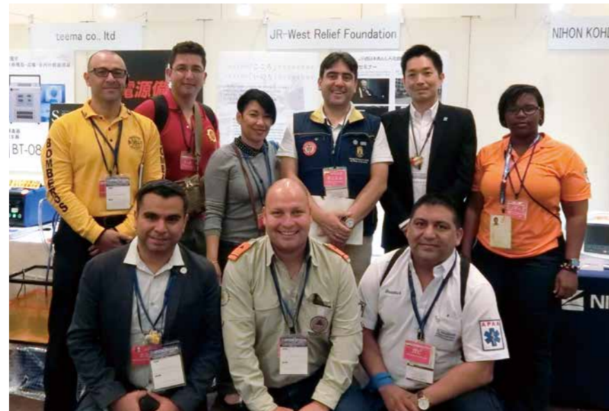
海外からの参加者と

10月16日～18日の3日間、シーサイドホテル舞子ビラ神戸にて「第14回アジア太平洋災害医学会」が開催されました。当日、国内外より災害医療関係者約500名が参加し、災害医療や防災対策などの最新動向について、シンポジウムやパネルディスカッションなどが開催されました。当財団も企業展示ブースに出展し、地域社会の安全構築を目指した財団の取り組みについて紹介を行いました。