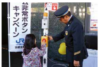
「ホーム非常ボタン」コーナー