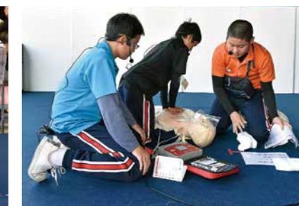
競技の様子(チーム「IKUNO～助け隊3年～」)