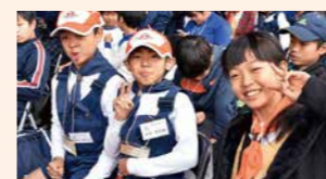
南ジュニア消防団Bチーム