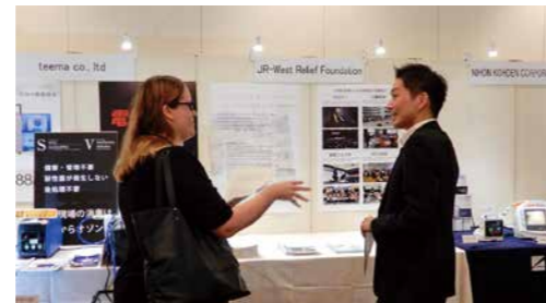
国連職員に財団の取り組みを説明している様子