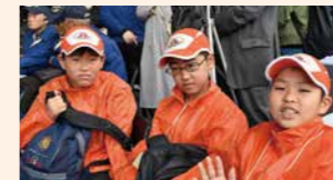
下京ジュニア消防団